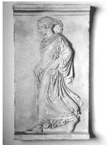
Gradiva-p1030638 | CC-BY-SA-2.0-fr

Se trata de conceptos psicoanalíticos sobre la construcción en análisis, o, mejor dicho, de la reconstrucción.